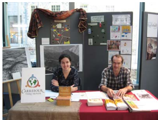
Un énorme merci aux bénévoles qui ont participé à la journée Nord Sud!