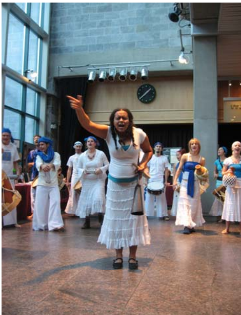
La troupe Pe Na Rua lors de leur prestation dans le cadre de la journée Nord Sud.