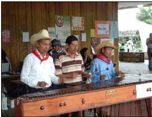
Trois joueurs de marimba, instrument national de musique.

Dans un autre ordre d'idées, ce forum était vraiment un endroit où l'inspiration et le désir d'agir étaient à l'honneur. En effet, de constater toutes les actions et les gens impliqués dans ce mouvement de changement, auquel j'adhère, me donnait beaucoup d'énergie. Ça m'a permis d'en apprendre davantage sur les différentes luttes et actions dans le reste des Amériques. La présence d'activités sur la culture guatémaltèque m'a aussi permis d'approfondir mes connaissances sur ce pays. Avec une population indigène de plus de 50 %, il était d'autant plus pertinent et intéressant d'assister à des cérémonies mayas et aux spectacles de danses et de musiques traditionnelles.