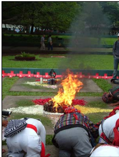
Cérémonie maya en hommage aux martyrs tués le 31 janvier 1980 à l'ambassade de l'Espagne au Guatemala.

Pour l'occasion, les divers mouvements populaires, sociaux et autochtones s'étaient donnés rendez-vous pour discuter des alternatives au capitalisme et au néolibéralisme. Et le besoin des participantEs de parler haut et fort des effets néfastes de ce système s'est grandement fait ressentir. D'ailleurs, l'Université de San Carlos, dans la ville de Guatemala, a vibré grâce aux pièces de théâtre, cérémonies mayas, conférences, ateliers, spectacles musicaux et rassemblements populaires. L'évènement a même fait des vagues en dehors du campus. Notons par exemple la manifestation clôture du 12 octobre 2008 qui a permis à plus de cinq mille manifestantEs de prendre d'assaut les rues du centre-ville pour exprimer leur mécontentement relativement aux mines à ciel ouvert, aux effets néfastes du libre-échange et aux politiques gouvernementales favorisant l'implantation de grandes compagnies étrangères sur leur territoire.