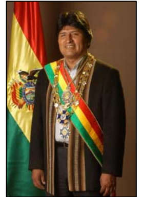
Evo Morales, Président de la Bolivie

Même si ce forum se veut par définition, avant tout, un espace de discussions, certaines actions concrètes ont été réalisées. Tout d'abord, les participants ont pu souligner leur appui par des pétitions, notamment avec celle appuyant le Président Evo Morales de la Bolivie qui souhaite modifier sa constitution et la diriger vers un virage plus « socialiste » en sortant notamment les compagnies étrangères du pays et en affirmant que l'eau ne peut être privatisée. Les revendications du Président Morales ont fortement été saluées lors de ce forum. Ces actions vont directement dans le sens de l'Équateur qui a, le 28 septembre 2008, modifié sa constitution afin de garantir la gratuité de la santé et de l'éducation ainsi que la reconnaissance des indigènes. Le président de ce pays, Rafael Correa, a aussi pris soin de s'assurer qu'il n'y aurait plus d'ingérence et d'abus de la part des multinationales. C'est d'ailleurs pourquoi l'État pourra se réserver le droit de contrôler, d'administrer et de réguler notamment l'énergie sous toutes ses formes, les télécommunications, les ressources naturelles non renouvelables et le raffinage d'hydrocarbures.