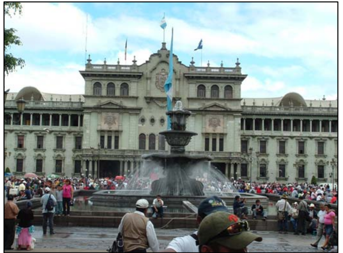
Parc central, en face du palais présidentiel, zone 1, Ville de Guatemala

« Aquí sí, otro mundo es posible » tel était le slogan du troisième Forum social des Amériques qui s'est déroulé du 7 au 12 octobre 2008 au Guatemala.